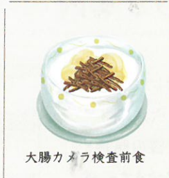
大腸カメラ検査前食