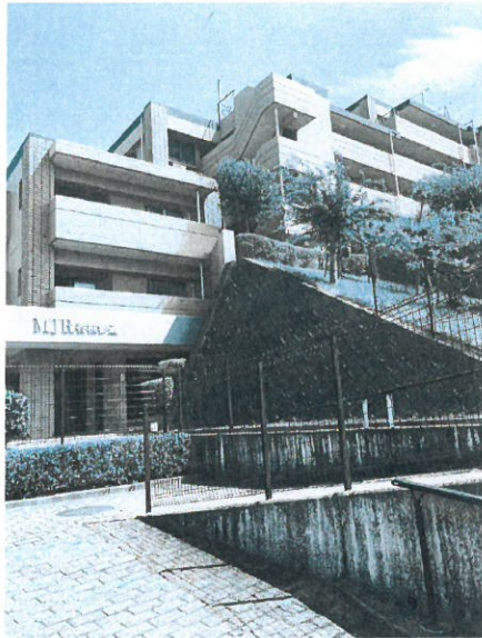
[外観・現況][外観写真]

随時、内覧受付中！お気軽にお問合せ頂き、ご予約ください。 仲介手数料(約121万円)がかからず、諸費用がお得な物件です。