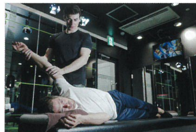
お客様は寝ているだけ

体の状態を把握した上で、お客様一人ひとりに合わせたストレッチを行い、自分では気づかない不調箇所も発見できます。