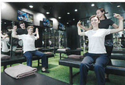
お客様に合ったストレッチ

体の状態を把握した上で、お客様一人ひとりに合わせたストレッチを行い、自分では気づかない不調箇所も発見できます。