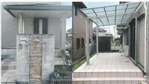
糸島市南風台7丁目