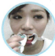
マウスオープナーを装着し汚れを拭き取ります。