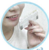
現在の歯の色を確認。