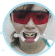
LED保護メガネを装着します。