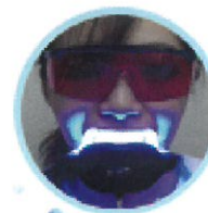
ホワイトニングを開始します。