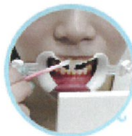
薬剤を歯に塗布します。