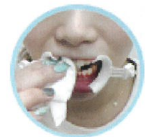
薬剤を拭き取って終了。